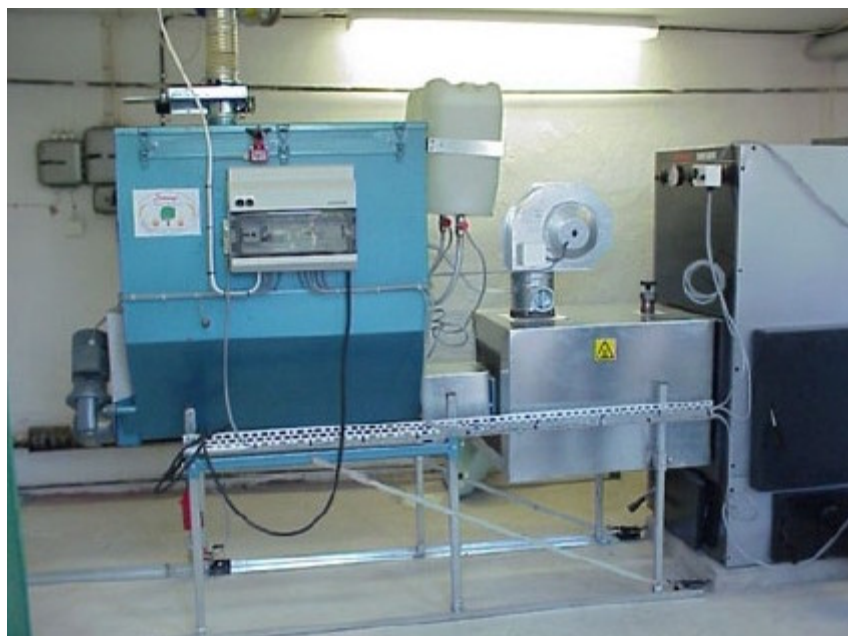
Foto 1. Uniwersalny palnik na biomasę FARMHEAT firmy SCANBIO.

Uniwersalny zestaw FARMHEAT (foto 1) przystosowany jest do spalania różnych rodzajów biomasy w postaci: ziarna zbóż, makuchów rzepakowych, słomy, trocin, zrębków drzewnych, peletów, brykietu i innych. Oferowany zestaw składa się z palnika, przedpaleniska, zbiornika i przepustnicy. Moc cieplna palnika to zakres od 20 do 120 kW i jest uzależniona od typu palnika jak również od rodzaju zastosowanego paliwa (rys. 1).. Palnik FARMHEAT cechuje funkcjonalność poprzez możliwość współpracy z dowolnym kotłem na paliwo stałe jak również z większym, zewnętrznym magazynem paliwa za pośrednictwem bezobsługowego podajnika. Trzy niezależne systemy kontrolują bezpieczeństwo prowadzonego procesu spalania oraz zapewniają dłuższą żywotność i sprawność palnika.