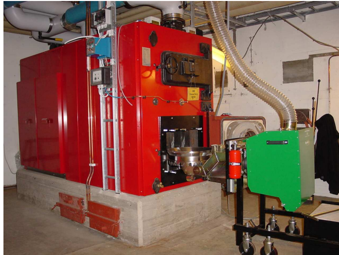
Kotłownia o mocy 300kW

Stosując odnawialne źródła energii można zredukować koszty ogrzewania o połowę w porównaniu z kosztami opalania olejem opałowym. W porównaniu z opalaniem węglem, koszty ogrzewania biomasą można zredukować o 20% do 40%. To może oznaczać oszczędności rzędu kilkudziesięciu tysięcy złotych rocznie!