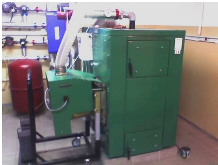
Kotłownia 75kW w nadleśniczówce w Bobolicach

Kotłownie na pelety alternatywa zarówno do oleju jak i węgla