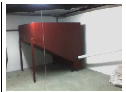
Magazyn do kotła 75kW

Większy pojemnik można urządzić w pomieszczeniu budując skosy ze sklejek i desek lub wbudowując elementy podłogowe ze stali. Ważne są odpowiednie skosy w dolnej części pojemnika, aby opróżnianie odbywało się równomiernie. Magazyny na pelety projektowane są indywidualnie dla każdego klienta.