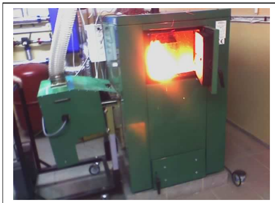
Kocioł z palnikiem 75kW