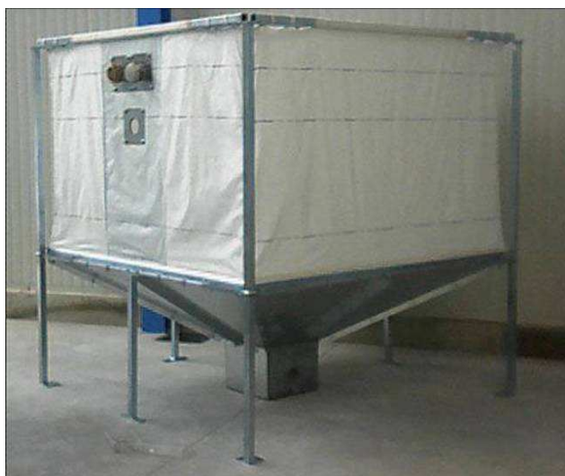
Foto 2. Urządzenia dodatkowe – zasobnik na paliwo (ziarno) (mat. reklamowy)