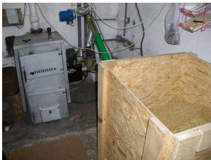
Foto 3. Zbiornik na ziarno wykonany w sposobem gospodarczym (mat. reklamowy)