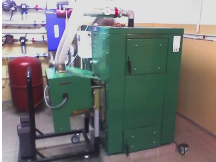
Kotłownia 75kW w nadleśniczówce w Bobolicach

Kotłownie na pelety alternatywa zarówno do oleju jak i węgla